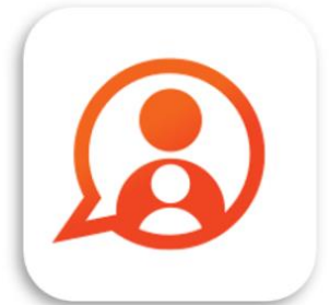
Konnect OuderApp Konnect B.V.